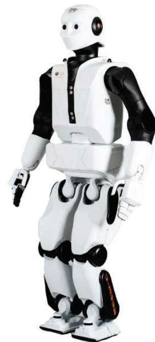
PAL Robotics의 실물 크기 2족 휴머노이드 로봇 REEM-C

로봇 설계와 프로그래밍, 조립은 모두 바르셀로나 PAL Robotics 지사에서 진행되며, 엔지니어팀이 로봇의 기능을 지속적으로 개선하는 일에 매진하고 있습니다.