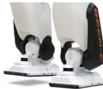
걷는 단계에서 한 발로 균형을 유지하는 REEM-C

컨트롤러의 목표는 로봇의 질량 중심(CoM) 위치를 조정하여 ZMP 지점을 항상 지지 영역(발 아래) 안에 유지하는 것입니다. 2족 동적 보행에 성공하려면 로터리 엔코더 피드백을 통해 위치, 속도 및 가속도에 대한 다리 관절 각을 정밀하게 제어해야 합니다.