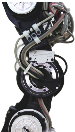
REEM-C knee joint with AksIM™ absolute rotary encoder system

Renishaw 제휴사 RLS의 비접촉식 마그네틱 엔코더가 솔루션으로 선정되었습니다. 여기에는 무릎에 내장되는 AksIM™, Orbis™ 등의 로터리 엔코더(왼쪽 사진), 손목과 팔꿈치 관절 및 구성품에 중분형 RoLin™ 시스템 등이 포함됩니다.